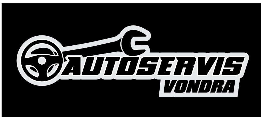
černobílé logo na černém pozadí