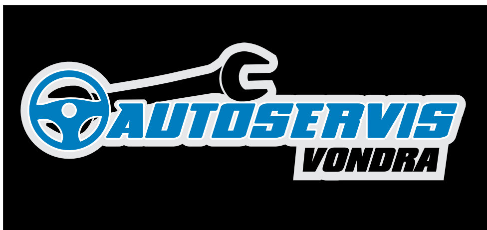
Logo lze nezměněné použít i na tmavém pozadí