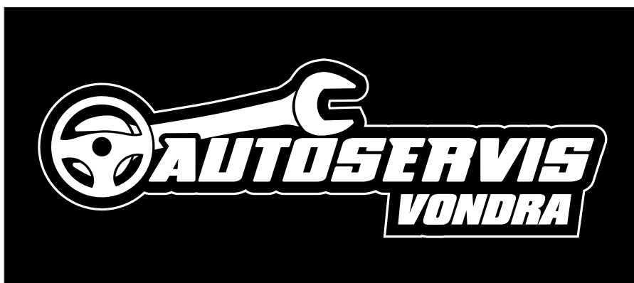
Inverzní monochromatické logo na černém pozadí