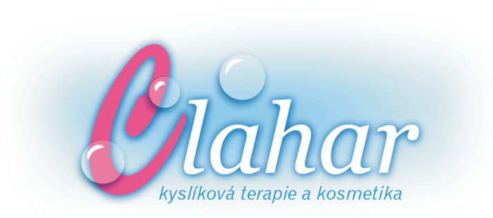
Rastrové barevné logo

Využití loga je doporučeno především v elektronické podobě, jako je webová grafika.