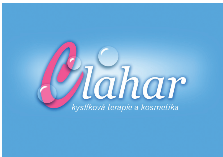
Rastrové barevné logo