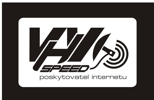
Inverzní monochromatické logo na černém pozadí