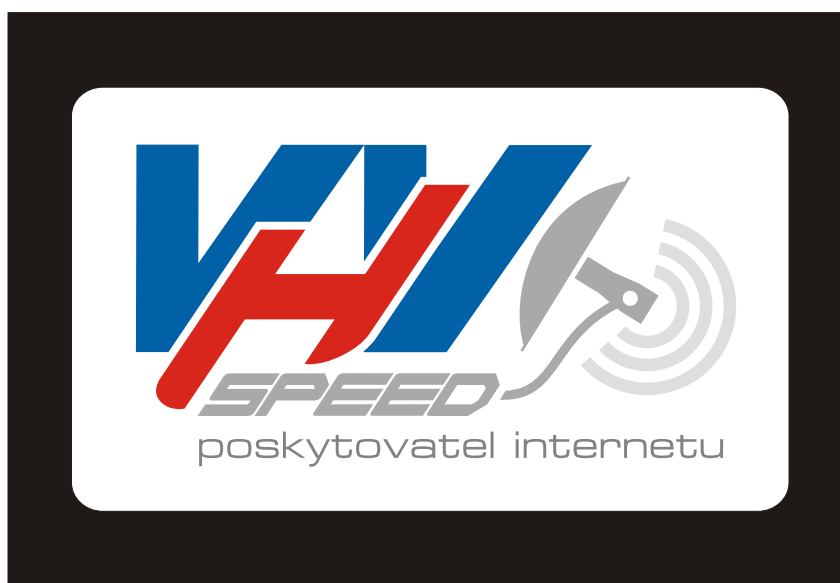
Na tmavém pozadí lze logo použít jen s bílým podkladem se zaoblenými rohy